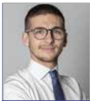
Pedron Gianluca Edilizia Privata, Urbanistica