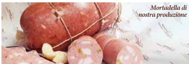
Mortadella di nostra produzione

Via della Pieve, 23 Sant'Eufemia di Borgoricco - PD Tel. 049 5798104 SEGUICI SU