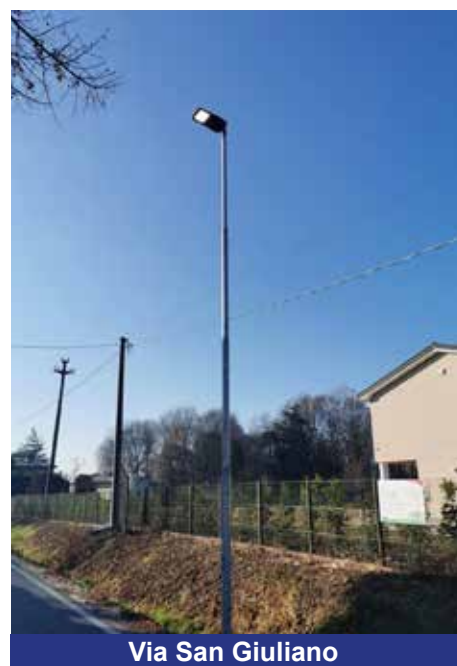
Via San Giuliano