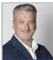
Peron Samuele Sport e Sicurezza