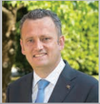
Sindaco MAURO DAL ZILIO

Attività Istituzionali, Demografici, Personale, Forme associative tra Enti Locali, Partecipate, Trasporti Pubblici, Aeroporto, Sicurezza e Polizia Locale, Protezione Civile, Manifestazioni, Associazionismo