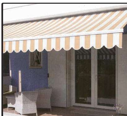
Tenda a Braccia Larg. 3480 - Sp. 210 Euro 590,00