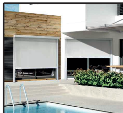
Tenda Oscurante con cassonetto e guide Zip Larg. 300 - H. 250 Euro 650,00

CAMBIO TELO SU OGNI TIPO DI TENDA A PREZZI IMBATTIBILI