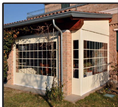
Rullo con cassonetto, finestra e guide antivento Larg. 350 - H. 250 / €550,00