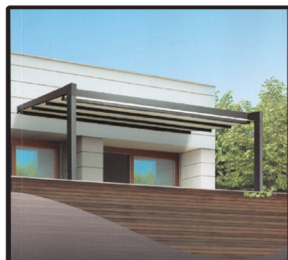
Tenda Pergola con motore Larg. 450 - Sp. 400 Euro 2.800,00