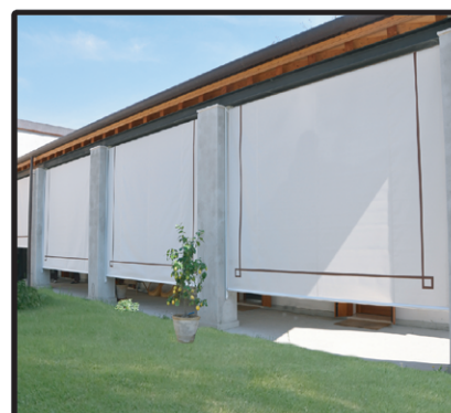
Tenda a Caduta guide in acciaio Larg. 400 - H. 300 Euro 450,00