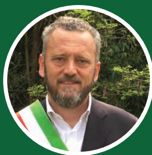
Sindaco Dal Zilio Mauro