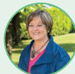
DA FORNO ISABELLA da giugno 2009 a oggi